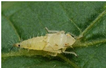
Larve CFD

Des comptages de larves de Cicadelles de la Flavescence Dorée sont en cours dans les zones soumises à Traitement Obligatoire afin d'évaluer les populations avant traitement sur des parcelles sensibles (proche des foyers ou sans efficacité des traitements en 2018). Certains pièges jaunes sont ainsi posés dans le vignoble pour signaler notre passage. Ils serviront au monitoring de l'insecte pendant l'été.