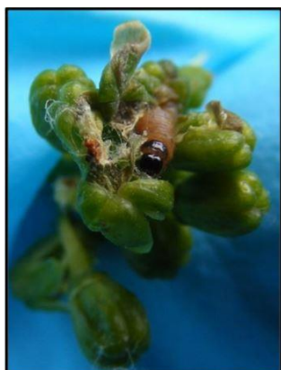
Larve de Cochylis

L'observation consiste à dénombrer les cocons de soie formés par les larves et permet d'évaluer le niveau de pression exercée par le ravageur en début de campagne. L'ouverture de ces cocons, afin de déterminer si une chenille est présente à l'intérieur et son espèce, augmente la précision.